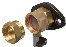
Kit DN 20-25