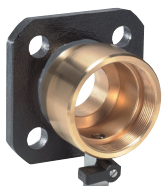
Kit DN 40