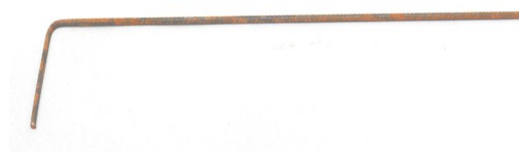
Chapeaux de renfort