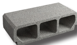
Entrevous béton bords droits