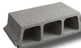
Entrevous béton TP (ou mixte)