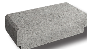
Entrevous béton borgne