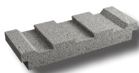
Entrevous béton négatif