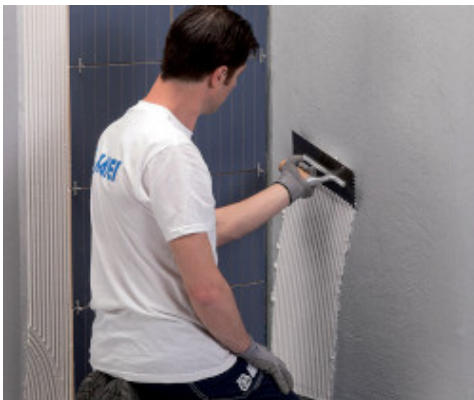
Pose du revêtement mural avec Keraflex Maxi S1