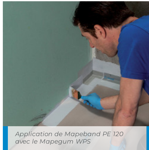
Application de Mapeband PE 120 avec le Mapegum WPS