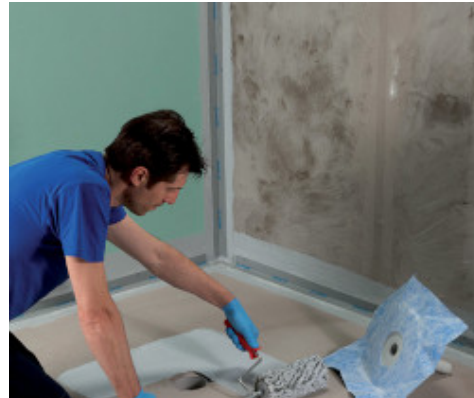
Application d'un raccord vertical de drainage avec Mapegum WPS