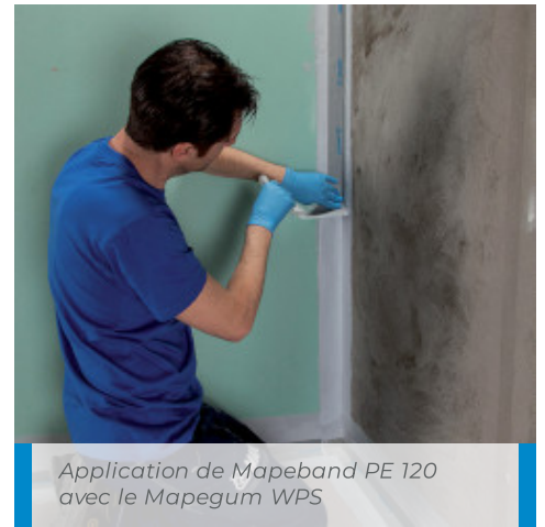
Application de Mapeband PE 120 avec le Mapegum WPS