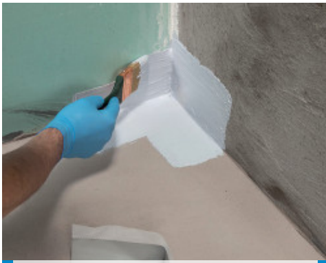
Application d'une pièce d'angle 90° de Mapeband PE 120 avec Mapegum WPS