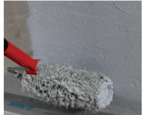
Application du Mapegum WPS au rouleau