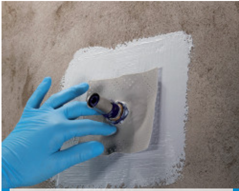
Application d'un joint Mapeband PE 120 pour les trous traversants avec Mapegum WPS