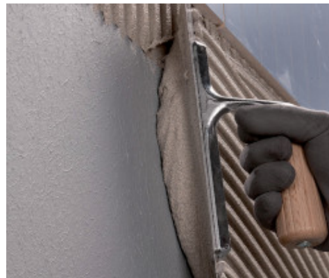
Pose d'un revêtement de sol avec Ultramastic III