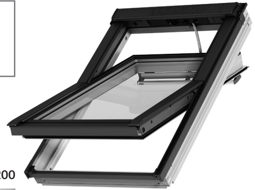
Commande tactile KLR 200