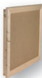
trappe de comble à recouvrement

Cadre Sapin du Nord et panneaux de particules issus de forêts gérées durablement.