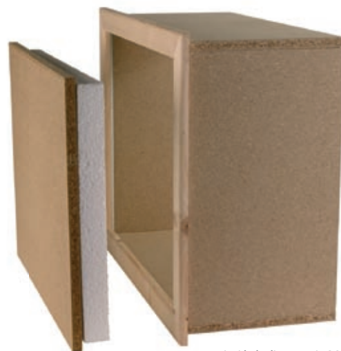
trappe isolée à réhausse de 26 cm