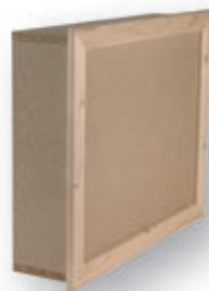
trappe de comble avec rehausse