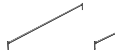
Lisse latérale RCM 630 Lisse d'extrémité RCM 608