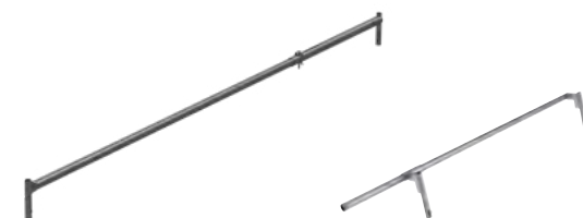
Lisse réglable RCM73 Lisse réglable pour angle 0 à 90°