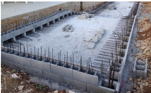
2 - Ferraillage