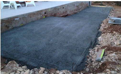
1 - Béton de propreté