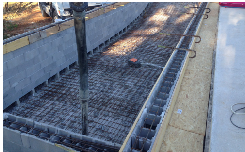
4 - Coulage du radier et murs en une seule opération