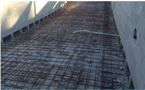
3 - Alphabloc associé aux blocs de coffrage enduits + ferraillage