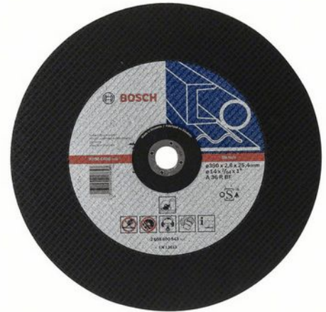
Image du produit, non emballé