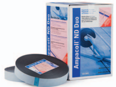
Ampacoll® ND Duo: Beidseitig klebendes Nageldichtband