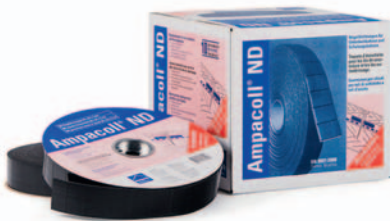
Ampacoll® ND 60: Nageldichtungen, 60 mm breit