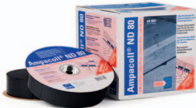
Ampacoll® ND 80: Nageldichtungen, 80 mm breit