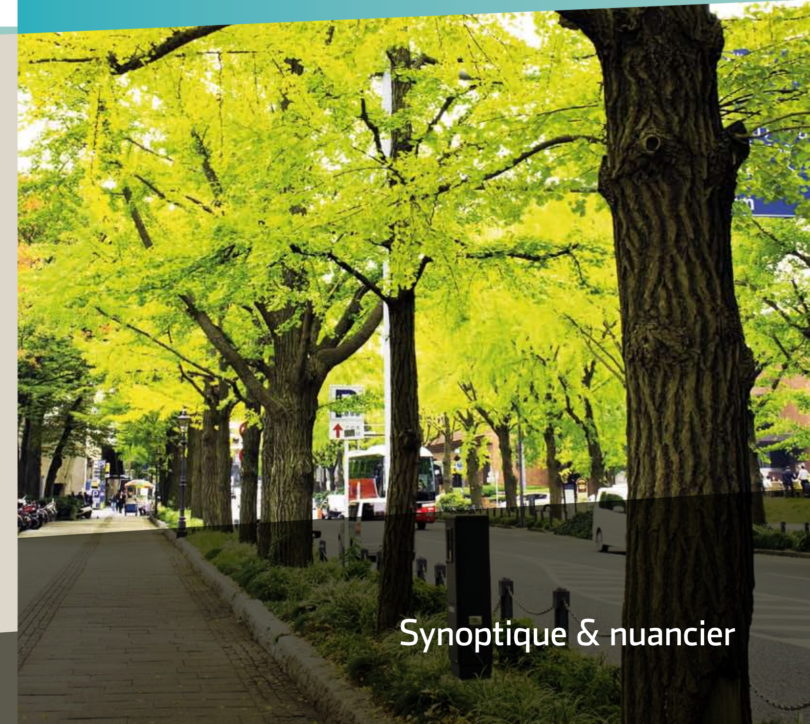
Illustration : Alkern / Voirie - Photos non contractuelles - 07/12

Pour disposer de renseignements techniques ou pour connaître les produits disponibles dans votre région, contactez votre agence régionale