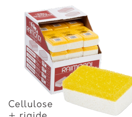
Cellulose + rigide