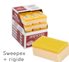
Sweepex + rigide