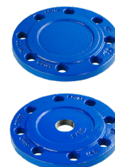
PLAQUES PLEINES, ALÉSÉES, TARAUDÉES DN 40 À DN 700