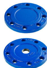
PLAQUES PLEINES, ALÉSÉES, TARAUDÉES DN 40 À DN 700