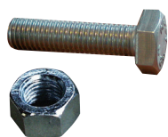
VISSERIE ÉLETROZINGUÉ, INOX, GEOMET