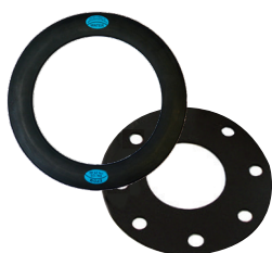
JOINTS HAUTES PRESSIONS