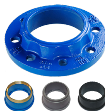
ADAPTATEUR DE BRIDES 390 POUR TUYAUX FONTE, PVC, PE