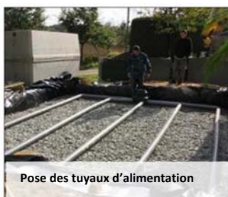
Pose des tuyaux d'alimentation