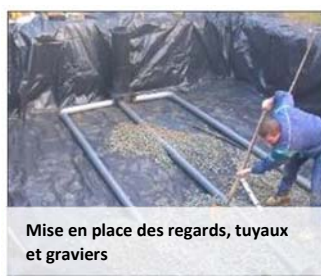
Mise en place des regards, tuyaux et graviers