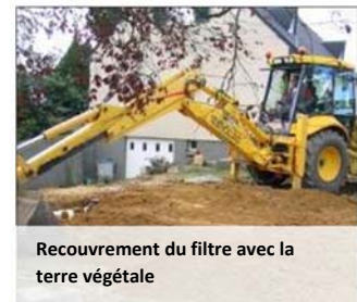
Recouvrement du filtre avec la terre végétale