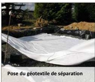
Pose du géotextile de séparation