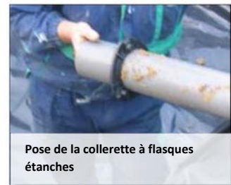
Pose de la collerette à flasques étanches