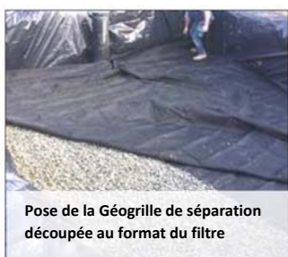
Pose de la Géogrille de séparation découpée au format du filtre