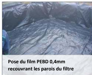
Pose du film PEBD 0,4mm recouvrant les parois du filtre