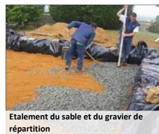
Etallement du sable et du gravier de répartition