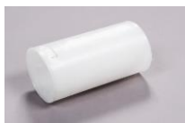
Manchon translucide Ø63 à 110 mm