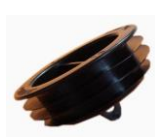
bouchon JanoPlus Ø 63 à 110 mm