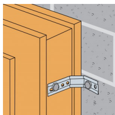
Fixation bois/ support rigide