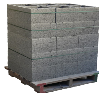
Palette piliers ECO 40

* Sur sol plat, prévu pour la charge (gerbage interdit sur chantier ou sol non adapté).