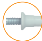
Version douille fraisée