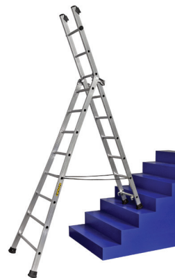
En position dénivelés