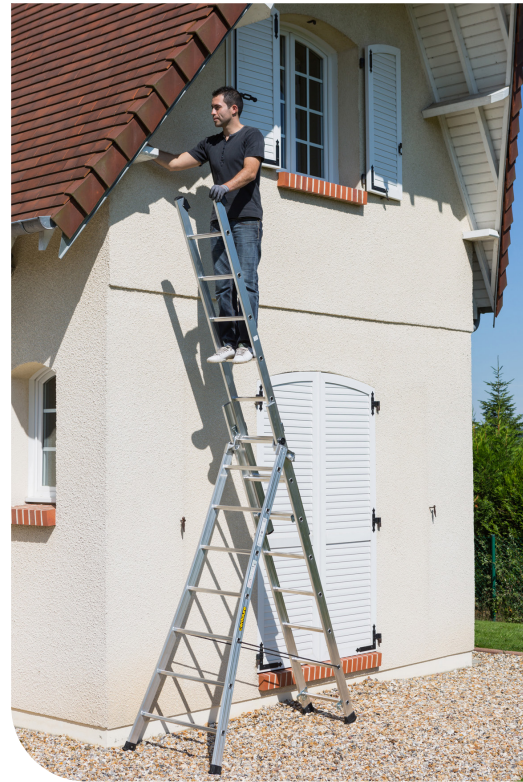
PRT3 7 + 2x8 barreaux Autostable aérienne

STABLE Sa conception en base évasée permet de contrer les irrégularités du sol et d'éviter les obstacles.