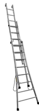
En position appui