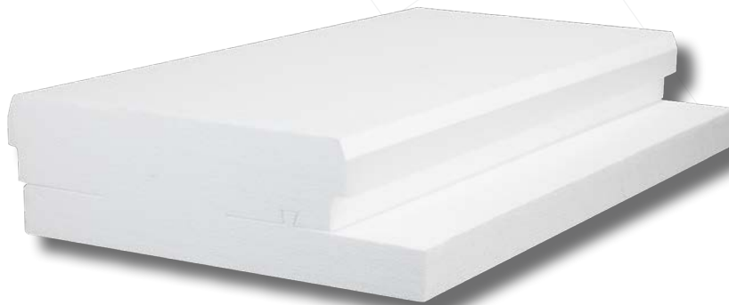
Entrevous poutrelles hybrides