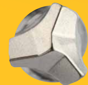
3 TAILLANTS POUR LES Ø5 À 7