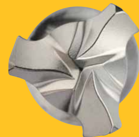
6 TAILLANTS POUR LES Ø8 À 20