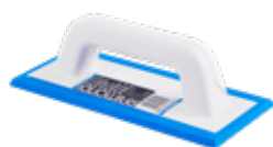
Azzurra & Azzurrina

Remplissent et lissent parfaitement les joints pour une finition impeccable !