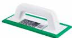
Verde & Verdina