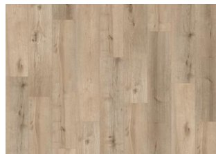
Sabiano CLW 228