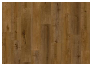
Marrone CLW 228