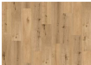
Roan CLW 228