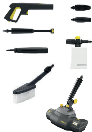
Nouvelle brosse terrasse Décape et nettoie plus efficacement