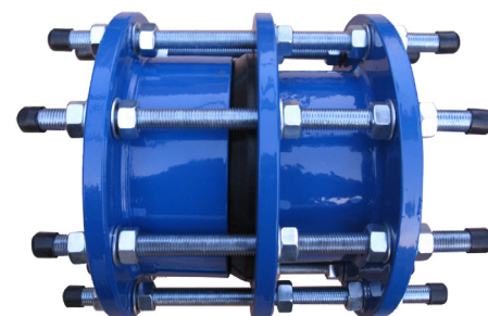
Revêtement époxy RAL 5015, épaisseur 250 µm (QUALITÉ WRAS)

Gamme : du DN50 au DN2000. Raccordement PN10/16 (DN50-150) et PN16 au delà. Boulonnerie en acier GEOMET 500® résistant à l'atmosphère marine. Revêtement époxy. Ajustement de +/- 25 mm.