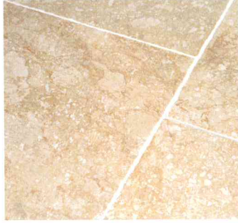
Bandes 40/2 Bandes 40/3