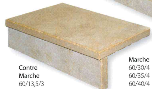
Contre Marche 60/13,5/3