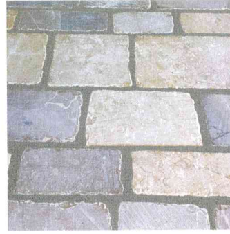
Vieille Ville ép. 6 cm - Couleurs mix Lg 8 -11-15