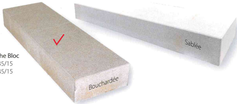
Marche Bloc 100/35/15 120/35/15