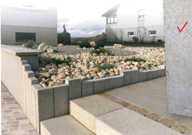
Palissades grenaillés 16/8 H 25 H 50 H 75 H 100