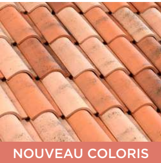
TERRE DE VIENNE