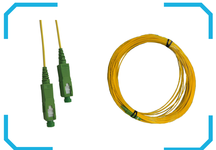
Cordon FO Simplex monomode 9/125 G657A2 GRADE B - SC APC/SC APC