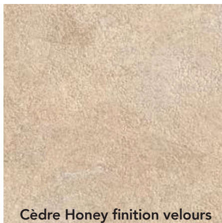
Cèdre Honey finition velours