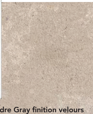
Cèdre Gray finition velours