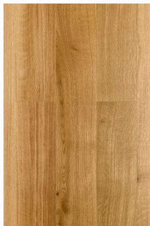
P131 Chêne Natur