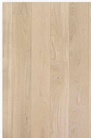
P132 Chêne Nuage