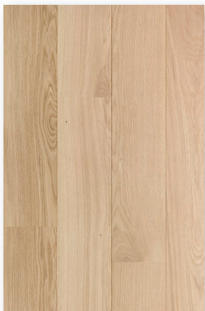
P122 Chêne Aube