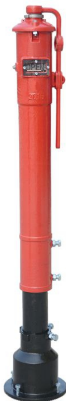
Poteau indicateur ref 9118