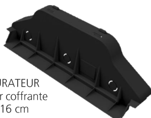
OBTURATEUR hauteur coffrante de 16 cm