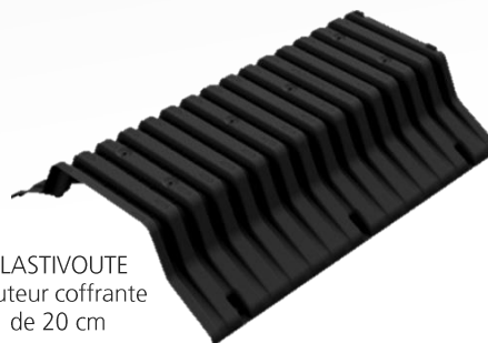
PLASTIVOUTE hauteur coffrante de 20 cm