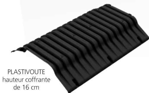
PLASTIVOUTE hauteur coffrante de 16 cm

NF EN 15037-5 Entrevous légers de coffrage simple NF 547