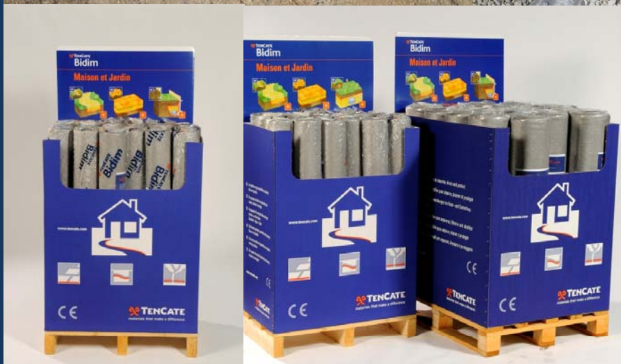
ILV et stop trottoirs à disposition.

Le 1 m x 25 m est livré en 2 ½ packs de 17 rouleaux, ou bien en 1 pack de 35 rouleaux.