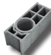
*Bloc multi angles