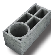
Bloc d'angle 2 lames d'air