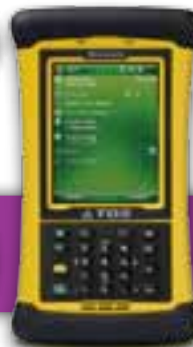
Vue du dessus