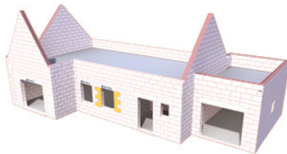
TABLEAU 27,4 cm

Les accessoires non rectifiés ne sont pas prévus pour une pose au fix'bric.