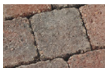
Rouge flammé noir