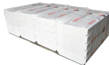
Palette de COFFRANT