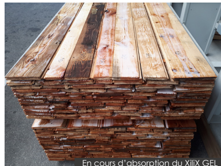
En cours d'absorption du Xilix GEL