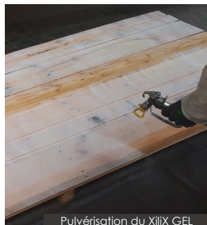
Pulvérisation du Xilix GEL