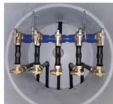
ISO CYL 600 5 DN15 1 Entrée 40 – 5 Sorties 25