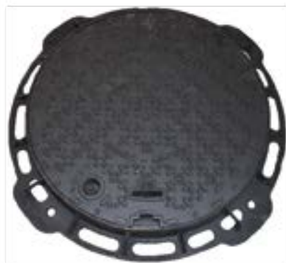
Cadre et couvercle fonte EN124 C250