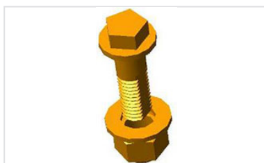
Verrous 1/4 de tour