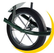
FIRST BASIC PRO roue PLEINE