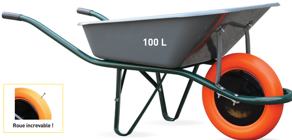
FIRST BASIC PRO roue INCREVABLE