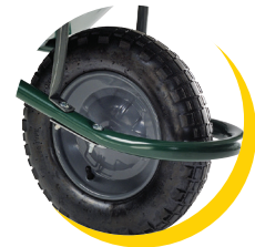
FIRST BASIC PRO roue GONFLÉE