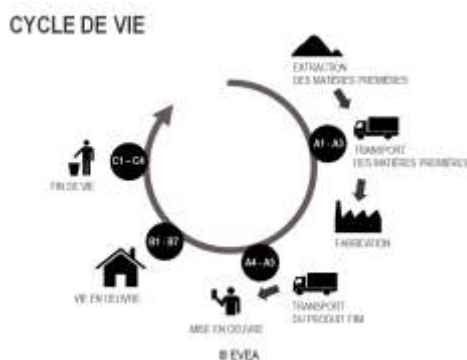
Diagramme de cycle de vie du produit :