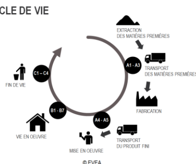
Diagramme de cycle de vie du produit :